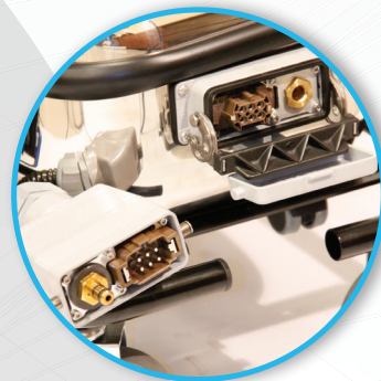
Sicherheitsstecker nach Industriestandard