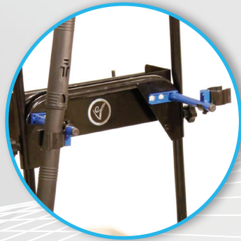
Zwei Halterungen für Zubehörteile