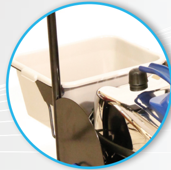
Korb für Zubehör und Tücher