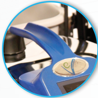
Industrie-Griff für separate Verwendung