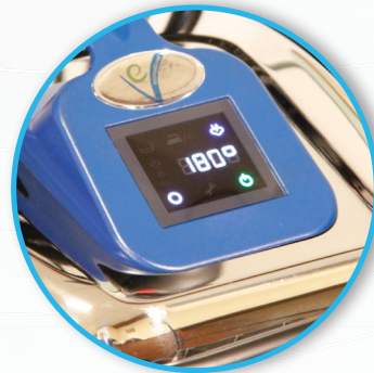
Touch Screen Display mit Zähler